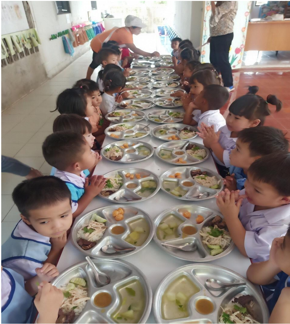
๒.๓ ศูนย์พัฒนาเด็กเล็กบ้านหนองบัว-หนองบัวหลวง