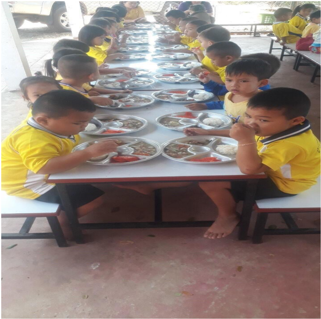
๒.๒ ศูนย์พัฒนาเด็กเล็กบ้านด่านพัฒนา